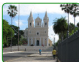
Igreja de São Benedito

As manifestações religiosas são as mais fortes expressões da cultura de um povo, os caminhos da fé são percorridos há milênios. A maioria das igrejas foi construída na época da fundação da cidade. Nesse roteiro constam a Igreja do Amparo (1º templo da cidade), Igreja de São Benedito, Igreja da e Nossa Senhora de Lourdes.