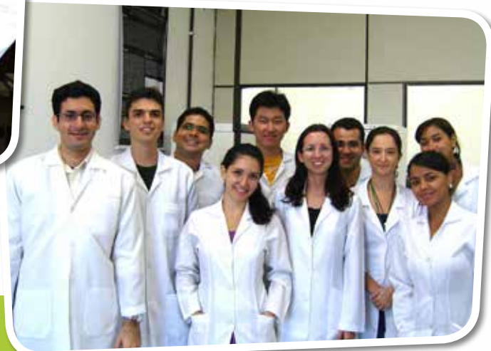
Equipe envolvida no desenvolvimento da vacina