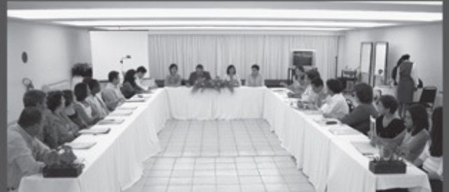
Posse ocorrida na gestão 2004/2008

Composto por 10 conselheiros efetivos e 10 suplentes, representantes dos nove estados nordestinos, o CRBio-05 é o responsável pela regulamentação, fiscalização e garantia do exercício da profissão de biólogo.