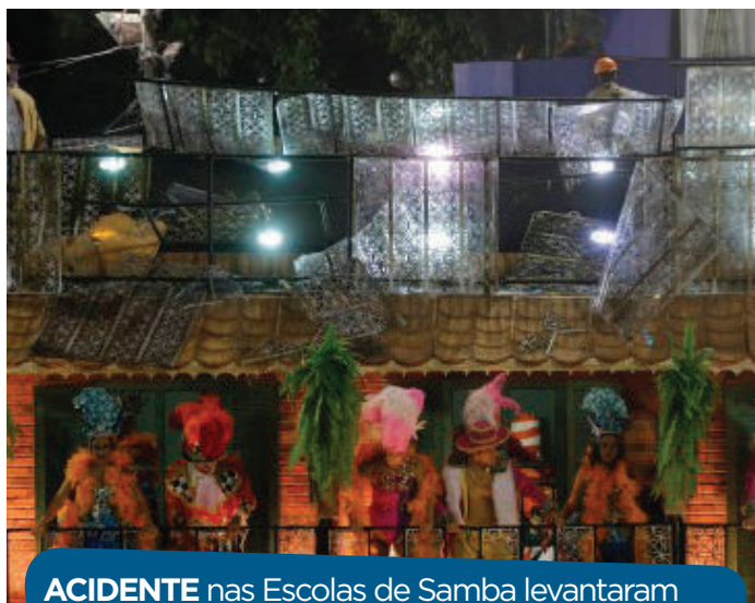
ACIDENTE nas Escolas de Samba levantaram questionamentos sobre importância da ART

Documento obrigatório, a ART identifica o profissional res-