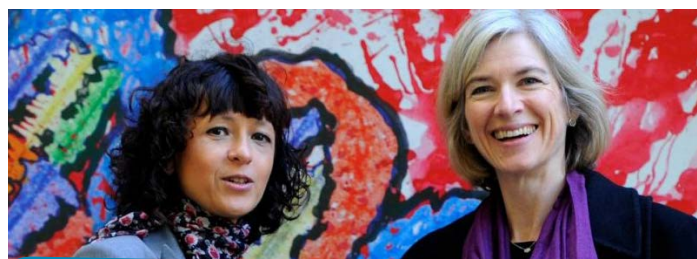
Pesquisadoras da França e Estados Unidos vencedoras do Nobel

Charpentier e Doudna ganharam um prêmio de 10 milhões de coroas suecas (cerca de US$ 1 milhão), que será dividido igualmente.